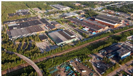
Finnslätten, Västerås största industriområde