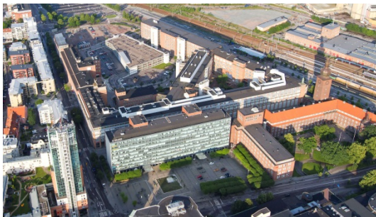
Östermalm Mimer, Västerås centrum